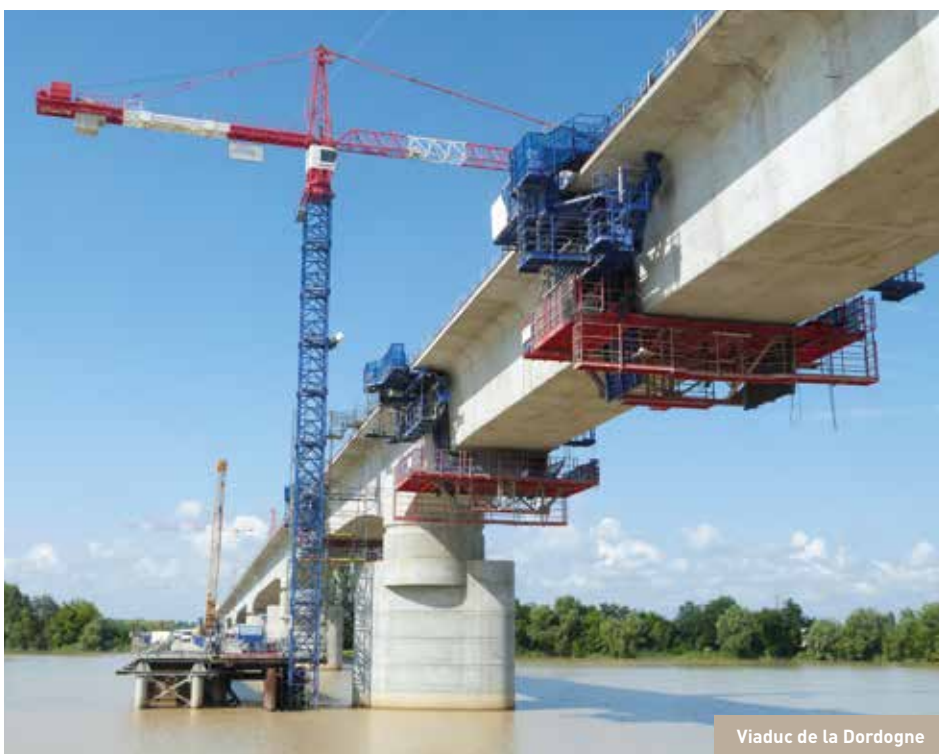
Viaduc de la Dordogne

Lors de la phase « infrastructures », de nombreux corps de métiers (coffreurs, maçons, soudeurs, charpentiers métalliques, foreurs...) sont intervenus pour la construction d'ouvrages d'art (ponts, viaducs, estacades...) dans des conditions parfois difficiles. La prévention des risques de chutes de hauteur est ici primordiale. 170 points de rencontre secours (PRS) ont été définis aux abords du chantier, le long d'axes routiers afin de permettre une intervention rapide des services départementaux d'incendie et de secours (SDIS) en cas d'accident. Des plans de secours, géo localisant ces PRS ont été distribués aux chefs d'équipes et des exercices de secours sont régulièrement organisés pour tester les procédures d'évacuation des blessés.