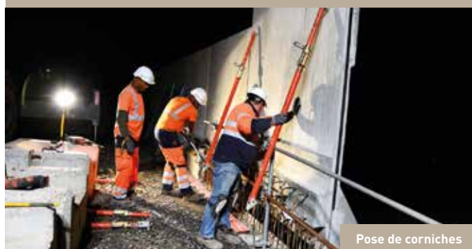
Pose de corniches