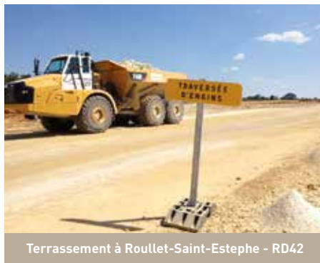
Terrassement à Rouillet-Saint-Estèphe - RD42

Autre risque identifié : le volume sonore très élevé près des machines de dépose du ballast ou dans les tranchées couvertes. « Le médecin du travail a procédé à des mesures du niveau de bruit dans la tranchée de Veigné longue de 1,7 km. En cas de volume excessif, il est demandé aux salariés de mettre impérativement des protections auditives – bouchons d'oreilles – ou des casques adaptés ». Constatant une hausse sensible depuis avril 2015 des cas de non-respect de port des équipements de protection individuelle (EPI : casque, lunette, gants, protections au-