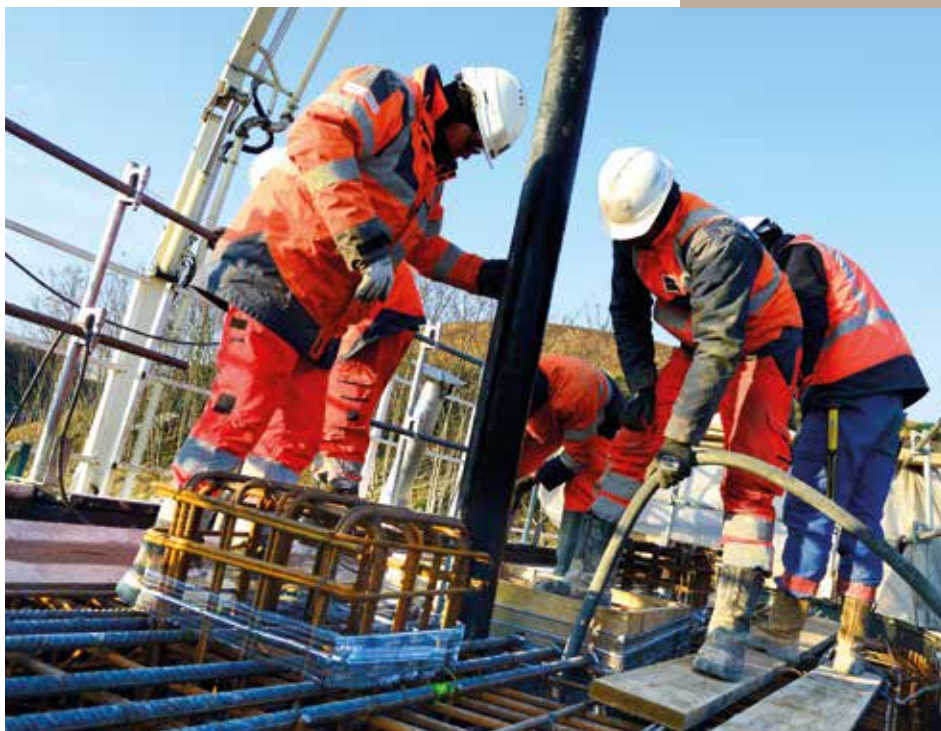
Ferrailage d'une estacade